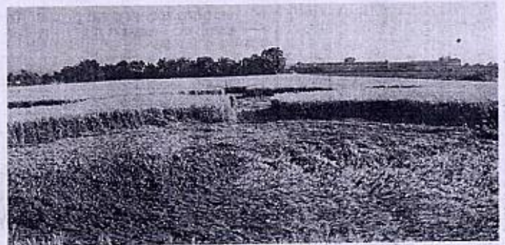
Uno dei "crop-circles" di Casei in dettaglio ravvicinato

CASEI. Nel film "Signs" di Mel Gibson li aveva fatti un alieno cattivissimo. A Casei, per il momento, non ci sono stati incontri ravvicinati del terzo tipo, ma i cerchi comparsi in un campo di grano ai confini con Pontecurone sono proprio quelli che gli ufologi indicano come segno sicuro dell'arrivo di entità extraterrestri.