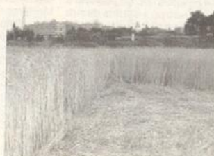
I cerchi e il triangolo (qui sopra) comparsi a Cormano

prossimità del cantiere per la realizzazione del sottopasso veicolare, dove in una notte sono comparsi i famosi e suggestivi cerchi nel grano. Infatti, il crop circle cormanesi, così vengono chiamati in gergo questi arzigogolati disegni, è formato da tre cerchi di differenti grandezze, il più grande ha 12 metri di diametro mentre gli altri due progressivamente 6 e 4 metri e da un triangolo con il lati lunghi all'incirca 13 metri uniti tra loro da linee lunghe rispettivamente 17- 8 e 6 metri realizzati mediante la piegatura degli steli delle spighe che non risultano però spezzati.