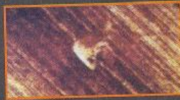
◉ Tutte le tipologie umane nelle terrecotte precolombiane del Messico.