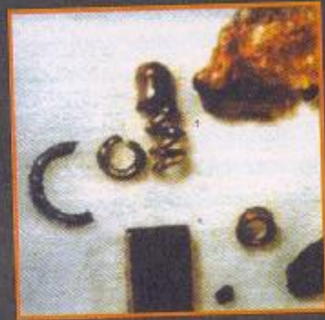
◉ Gli OOPART russi: viti e mezzelune.

brano frutto di una civiltà tecnologica molto evoluta, quale la nostra. Il termine di artefatti fuori posto è stato inventato diversi anni fa da uno scienziato eretico, il naturalista americano Ivan Sanderson (molto mal tollerato negli ambienti scientifici per i suoi studi sul mistero del triangolo delle Bermuda); con esso Sanderson intendeva indicare le decine e decine di oggetti anacronistici scoperti in questo secolo dagli archeologi e dagli stessi prontamente fatti spa-