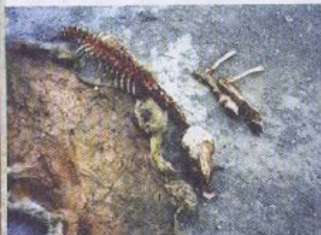
La carcassa di una pecora trovata mutilata a fine febbraio. La pelle è essiccata.