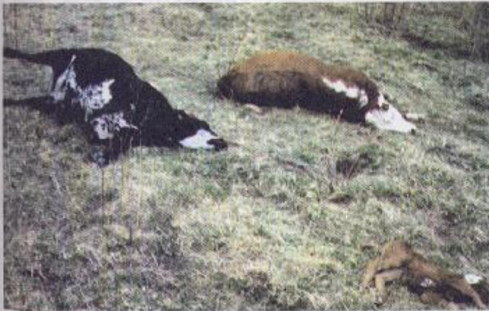
Il fenomeno delle mutilazioni animali è diffuso in tutto il mondo.

della giornalista americana Linda Howe, che ha portato all'attenzione del mondo questo fenomeno. E che ha dimostrato, dati alla mano, che in un buon cinquanta per cento dei casi in cui si trovano carcasse animali misteriosamente mutilate da una sorta di laser, testimoni hanno visto anche UFO nel cielo ed alieni sulla Terra.