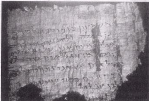
Gli antichi documenti scoperti a Qumran sono anch'essi oggetto di studio cabalistico a Saffed.

N on occorre ripercorrere la storia della Cabala, argomento ormai di casa sulle pagine del nostro giornale; diremo soltanto che la Cabala, il cui nome proviene dalla radice ebraica «Kbl» che significa «ricevere», ebbe a Saffed seguaci che influenzarono profondamente il mondo giudaico con libri co-